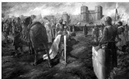
Quadre 10. Conquesta de València (28 de setembre del 1238). Mides (cm): 206 x 141

de Navarra. El resultat fou la derrota dels almohades d'al-Àndalus, i l'inici del domini dels cristians a la península Ibèrica amb les posteriors conquestes cap al sud, tant dels castellans (Còrdova, 1236 i Sevilla, 1248), com del mateix Jaume I (Mallorca, 1229 (quadre 7 i 8) València, 1238 (quadre 10) i Múrcia, 1266). La segona batalla protagonitzada pel pare de Jaume I fou, en aquest cas, la derrota a la vila llenguadociana de Muret, el dijous 12 de setembre de 1213, 12 davant les forces croades 13 de Simó de Montfort. Muret suposà la fi de l'expansió de la