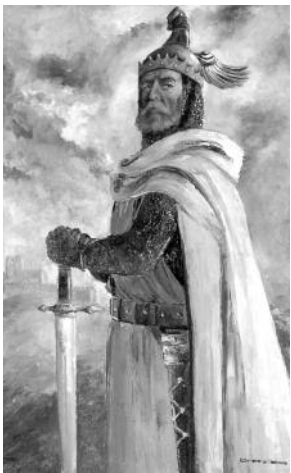
Quadre 1. El rei Jaume. Mides (cm): 84 x 127