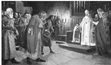
Quadre 4. Palau de la Suda (1214). Mides (cm): 157 x 100

armada i així fer valer els seus drets, tal com s'havia dibuixat en el privilegi de consolat, atorgat pel pare de Jaume I, el rei Pere el Catòlic, el 1197. Sens dubte, però, un pas important que permetria la consolidació del municipi fou la superació del dualisme existent en el domini de la ciutat, és a dir, la desaparició de la jurisdicció del comte d'Urgell (vigent des de la conquesta de Lleida, el 1149) i la conversió definitiva de Lleida en ciutat reial. Dita conversió s'esdevingué l'1 d'agost de 1228, mitjançant el pacte signat pel rei Jaume I i la comtessa Aurembiaix d'Urgell, 23 després que el primer afavorís les peticions de la comtessa de recuperar el seus estats urgellesos davant del que hom considerava usurpació per part del noble Guerau de Cabrera. A canvi, Aurembiaix retia homenatge feudal al rei i li cedia tots els drets que fins aleshores havien tingut els comtes d'Urgell sobre la ciutat de Lleida, que passava, tal com hem dit, així, a ser estrictament