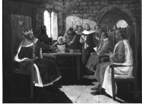
Quadre 12. El privilegi de la Paeria (Lleida, 19 d'agost del 1264). Mides (cm): 157 x 125

del regne de València, ajudats per tropes del regne de Granada i del nord d'Àfrica, i d'haver abdicat, uns dies abans, (Alzira, 21 de juliol de 1276) a favor del seu fill Pere. Volia acabar els seus dies a Poblet, on ja havia escollit sepultura, però no hi fou a temps. El seu fill, futur Pere el Gran, féu traslladar el cos fins al monestir amb gran solemnitat per al seu enterrament. Escoltem, ara, per acabar, les paraules del cronista Bernat Desclot, Llibre del rei en Pere , cap. 73: "Quan lo rei hac donada la sua gràcia a son fill l'enfant Pere, e l'hac beneït e li hac dites moltes bones paraules, e l'hac fet senyor e hereu de son regne, e l'infant en Pere, son fill, hac oïdes e enteses les sues paraules, plorant e sospirant de pietat e de gran dolor que havia de son pare, qui havia estat lo mellor rei qui anc fos e el pus agradable a totes gents, qui així es partia d'ell e de son regne, besà-lo en la boca, puis besà-li les mans e estec-li denant tota via, que anc per mejar, ne per beure, ne per dormir no se'n partí, tro que els àngels del cel vegren ab gran alegria, qui li preseren l'ànima del cors e la se'n muntaren al cel davant Déu. E l'infant En Pere féu venir tots los barons de la sua terra e els rics-hòmens de les ciutats, e ab gran honrament portà lo cors del