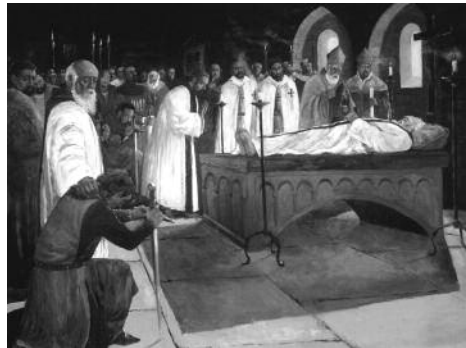
Quadre 14. La mort del rei. (Monestir de Poblet, 1276). Mides (cm): 225 x 185