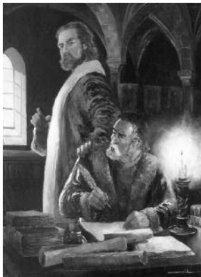
Quadre 13. El rei dictant la crònica (Xàtiva, 1244). Mides (cm): 108 x 141

Text anotat de la conferència visita guiada amb motiu de l'exposició celebrada a la Massana (Andorra), 2010