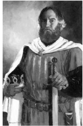
Quadre 2. Pere el Catòlic, rei d'Aragó (1196-1213). Mides (cm): 84 x 127

La primera batalla es produí a Las Navas de Tolosa (La Carolina, Jaén), el 16 de juliol de 1212. Els exèrcits del rei Pere combateren al costat de les hosts d'Alfons VIII de Castella i de Sanç VII