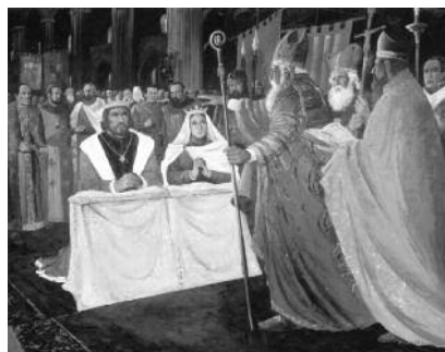
Quadre 9. El casament amb Violant d'Hongria (8 de setembre del 1235). Mides (cm): 225 x 185