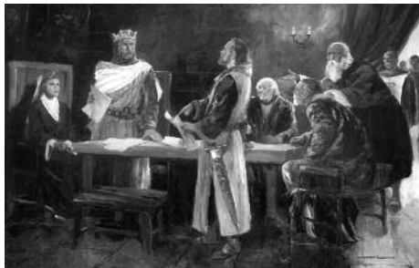
Quadre 6. Aurembiaix d'Urgell (agost del 1228). Mides (cm): 141 x 109