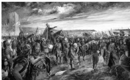
Quadre 7. L'estol al port de Salou (estiu del 1229). Mides (cm): 157 x 100