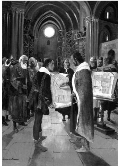
Quadre 11. Visita a les obres de la Seu Vella (1250-1260). Mides (cm): 108 x 141

I els serveis prestats tindran el seu premi. El pintor imagina una estada del rei a la Seu, l'actual Seu Vella, entre els anys 50 i 60 del segle XIII (quadre 11). Atesa l'especial vinculació del rei amb Lleida, és versemblant imaginar-se'l força interessat per l'obra arquitectònica de més abast i més innovadora bastida mai fins aleshores a Catalunya. Altrament, hi destina obligatòriament diners des del concili tarraconense celebrat a Lleida, el 1246. El dit concili, desenvolupat al convent dels franciscans, s'havia reunit bàsicament per solucionar un problema generat pel mateix rei, acusat d'haver fet tallar la llengua al seu confessor, el bisbe fra Berenguer de Castellbisbal, la qual cosa li valgué l'excomunió dictada pel papa Innocenci IV. El rei fou, finalment, absolt després d'haver-se declarat culpable i penedit personalment davant l'assemblea, el 14 d'octubre de 1246. 29 Però fou obligat a assumir algunes responsabilitats econòmiques com a penitència: possibilitar l'acabament de l'abadia cistercenca de Benifassà, filial de Poblet, tot assignant-li una renda anual de 200 marcs de plata; dotar l'hospital de