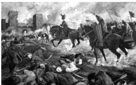
Quadre 8. La presa de Mallorca (31 de desembre del 1229). Mides (cm): 157 x 125